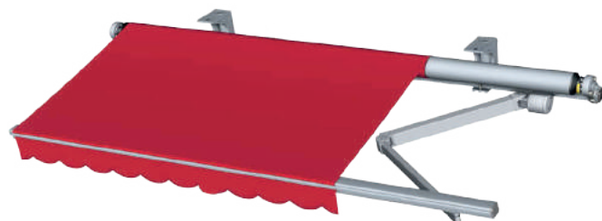
TABELA DE DIMENSÕES